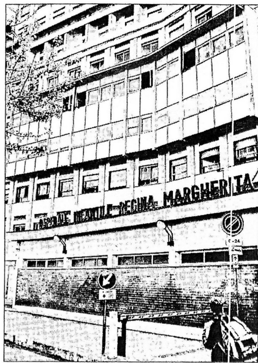
L'ospedale infantile Regina Margherita